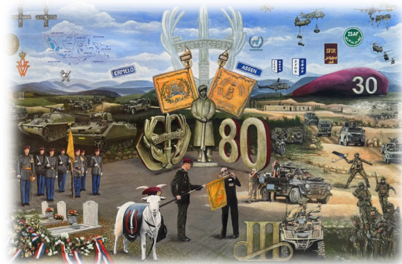
Het aangeboden schilderij "80 jaar Stoottroepen" is gemaakt door Jos Gelissen

In 1992 begon voor mij een lange periode van opwerken, eindoefening en werken bij 11 Luchtmobiele Brigade. Zonder twijfel de mooiste jaren van mijn loopbaan. Als, aoi opleidingsontwikkelaar (Schoolbat), aoi Heli Ops (Sie 3), maar ook als elnt ASIC (Sie 2) leerde ik vele namen en gezichten kennen binnen de brigade. Ook heel veel leden van 13 Infbat Lmbl, inmiddels omgedoopt tot 13 Infbat Regiment Stoottroepen Prins Bernhard.